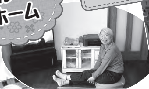
グループホーム での様子 (もかⅡ)