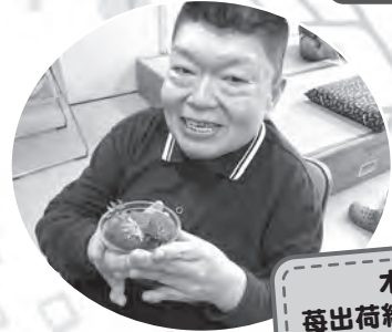
木越 莓出荷組合様より いただきました!!