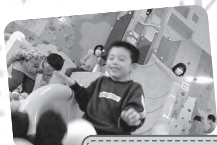
わくわくヒルズにて外出の様子