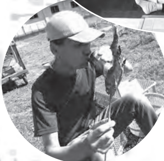
更生園夏祭りへの参加