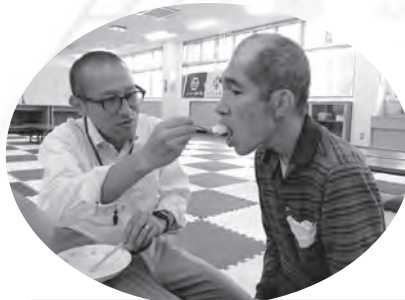
アイス屋さん来園 (園内行事にて)