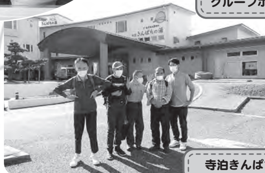
寺泊きんぱちの湯にて