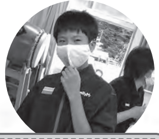
ファミリーマート様来園 (園内行事にて)