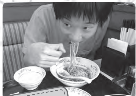
夏外出 餃子の王将にて 食事の様子