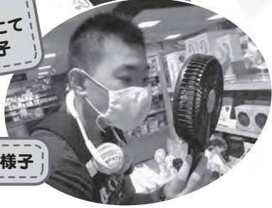
新潟市万代にて買い物の様子