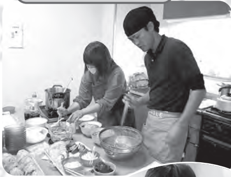
手づくりラーメン行事